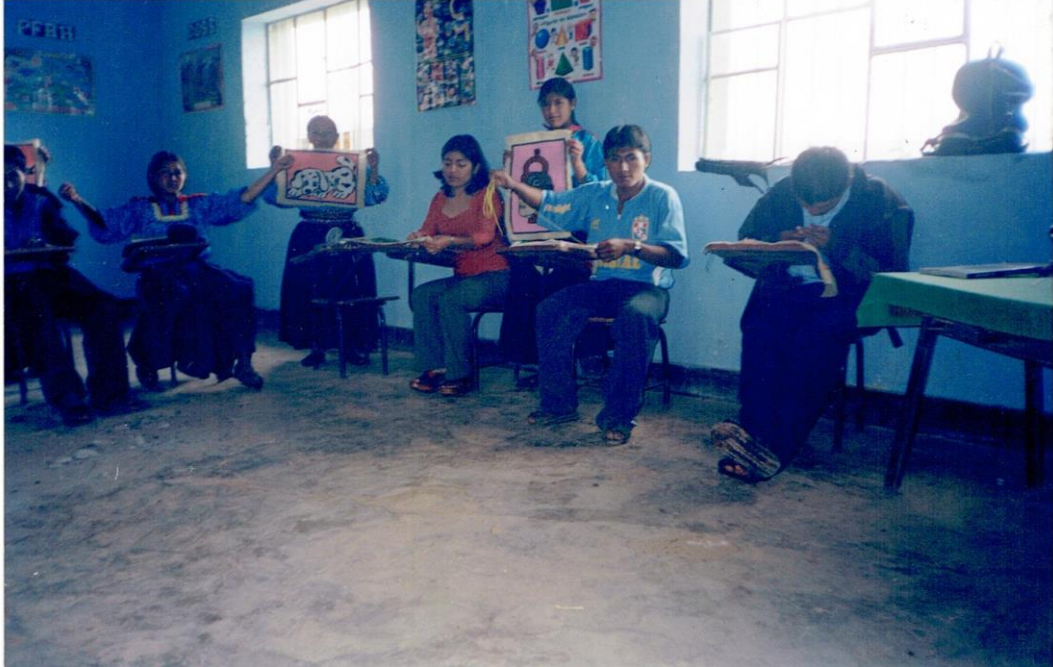
Foto N° 02: Estudiantes del cuarto grado hilando para su posterior confección de telares propios de su comunidad.

Foto N°1: Alumnos de la I.E.P.S.M.N° 11144 Caserío La Laguna del distrito de Kañaris, realizando tejidos artesanales.