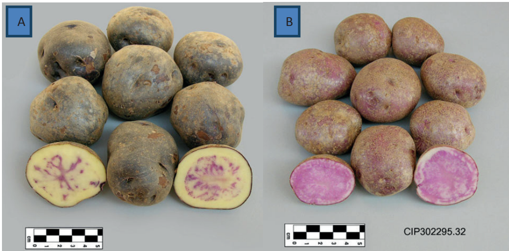
Fig. 2. Clones seleccionados por su alta estabilidad y rendimiento superior a la media general: (A) CIP302304.15; (B) CIP302295.32.