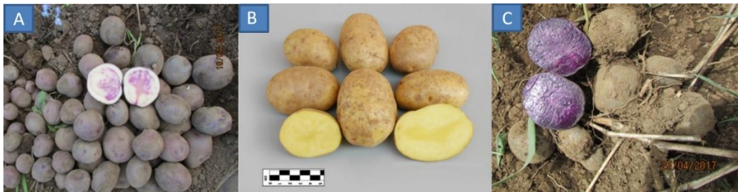
Figura 3. Clones con alta estabilidad de rendimiento comercial seleccionados por su bajo IGA y por su color de fritura; (A) Clon CIP 302299.28; (B) Clon CIP 302281.17 y (C) Clon CIP 302280.23 con alta estabilidad por su color de fritura.