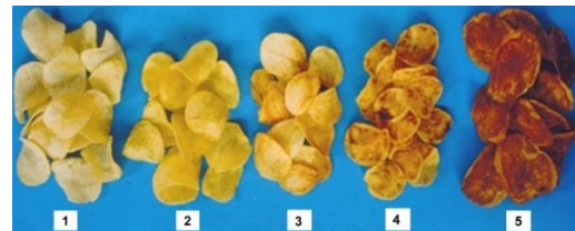
Figura 1. Escala subjetiva de colores, del Centro Internacional de la Papa.

Color de la fritura: La evaluación de este parámetro consistieron en coleccionar los tubérculos cosechados de cada localidad y luego se llevaron al Laboratorio de Mejoramiento Genético del Centro Internacional de la papa-CIP. Los tubérculos se cortaron en forma de hojuelas o chips, se lavaron y se introdujeron a una freidora de papa que tiene una canasta de metal con aceite caliente a temperatura de 180 °C, durante 2,5 min. Luego se determinó el color de las hojuelas fritas ( Figura 1 ), asignándoles el color de acuerdo con la escala subjetiva de colores, del Centro Internacional de la Papa, siendo este: (1): Blanco o amarillo cremoso, (2): Blanco o amarillo cremoso con muy poca presencia de oscuridad. manchas, (3): amarillo cremoso con baja presencia de manchas oscuras, (4): amarillo cremoso con tendencia a oscurecerse y (5): totalmente oscuro.