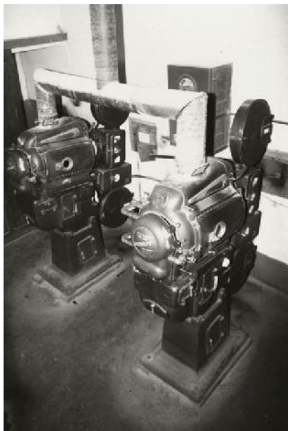
Proyectores utilizados en el Cine Norte (1952).