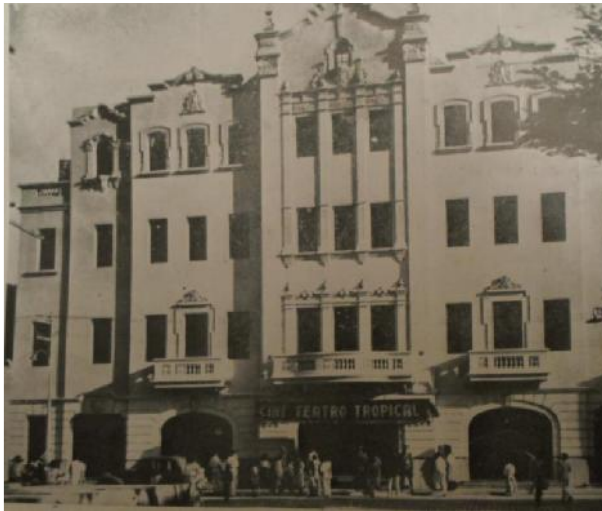
Fachada del Cine Tropical (1945).