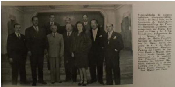
Fotografía tomada durante la inauguración del Cine Tropical (1945). En ella figuran el propietario del cine, sus socios e invitados especiales.