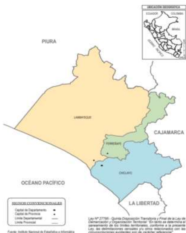
Mapa N° 01 INEI (2022) Mapa geográfico de la región Lambayeque

La región Lambayeque, según BCR (2018) se encuentra al noroeste del país, entre el Océano Pacífico (oeste) y las regiones de Piura (norte), Cajamarca (al este) y La Libertad (al sur). Políticamente se divide en 3 provincias (Chiclayo, Lambayeque y Ferreñafe) y 38 distritos, siendo Chiclayo la ciudad capital.