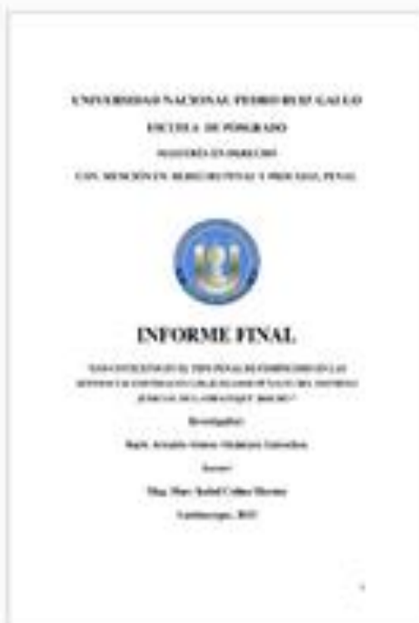
Mg. MARY ISABEL COLINA MORENO D.N.I 40997649 ASESORA

Autor de la entrega: Arnaldo Alonso Alcántara Colcochea Título del ejercicio: TESIS Título de la entrega: "LOS CONTEXTOS EN EL TIPO PENAL DE FEMINICIDIO EN LAS ... Nombre del archivo: INFORME_FINAL_DE_TESIS_-_ARNALDO_ALONSO_ALCANTARA... Tamaño del archivo: 1.78M Total páginas: 114 Total de palabras: 46,928 Total de caracteres: 240,946 Fecha de entrega: 18-mar.-2023 12:21p. m. (UTC-0500) Identificador de la entrega: 2086303967