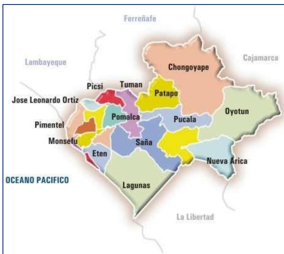
Mapa del distrito de Eten

Las distancias de Ciudad Eten - Chiclayo son: La ruta de Ciudad Eten por Puerto Eten a Chiclayo es de 20 kilómetros y la ruta de Ciudad Eten por Monsefú a Chiclayo es de 15 kilómetros.