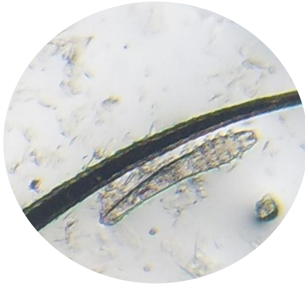
IMAGEN 7: Observaciones Microscópicas del ácaro Sarcoptes scabiei var canis