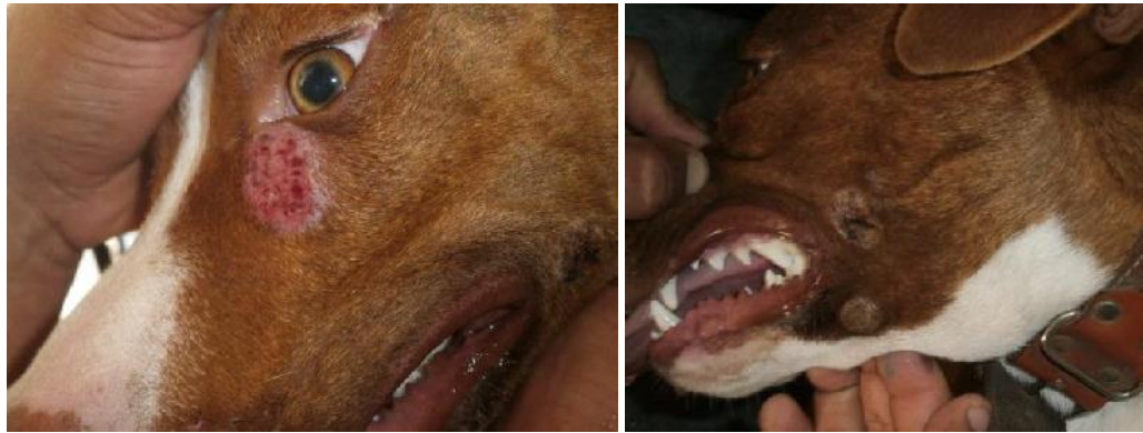
IMAGEN 2: Lesiones producidas por los ácaros de Demodex canis en su Forma Generalizada