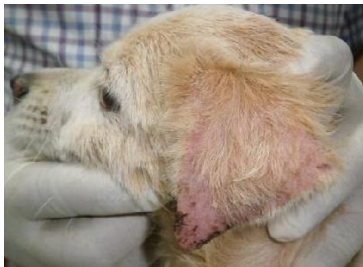
IMAGEN 4: Otras zonas afectadas por los ácaros de la especie Sarcoptes Scabiei var canis