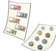
Billetes y monedas en papel, que podré elaborar