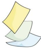
Hojas de reúso