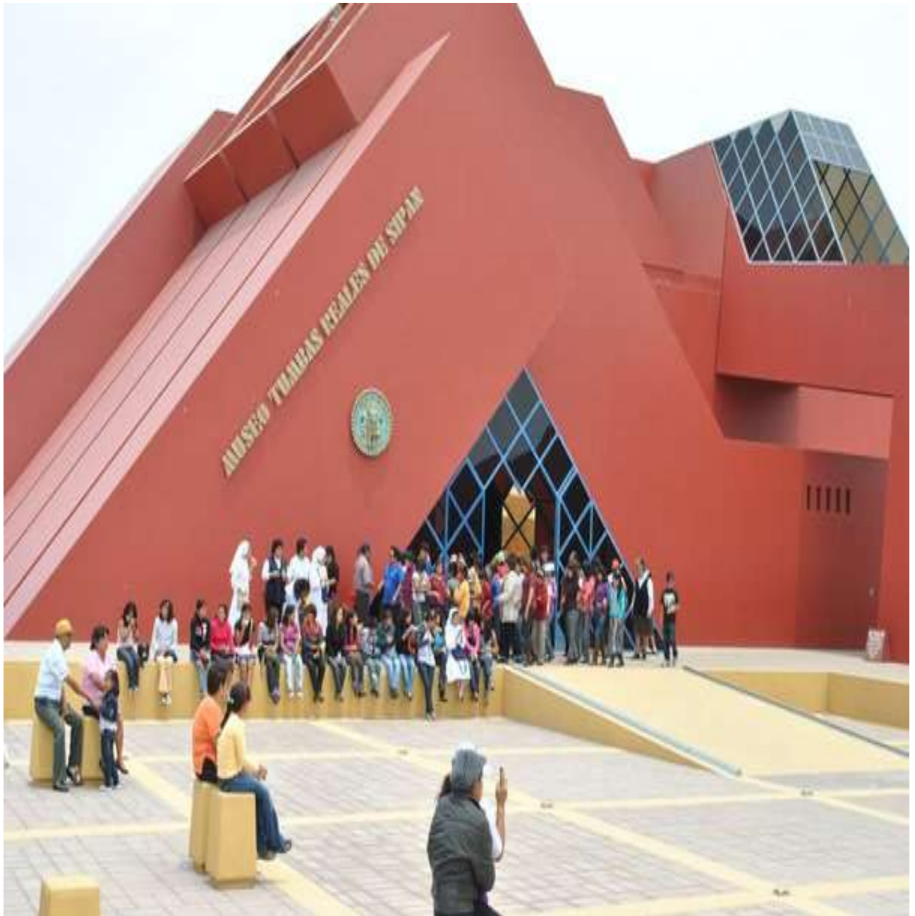
Museo Tumbas Reales, Lambayeque - Perú