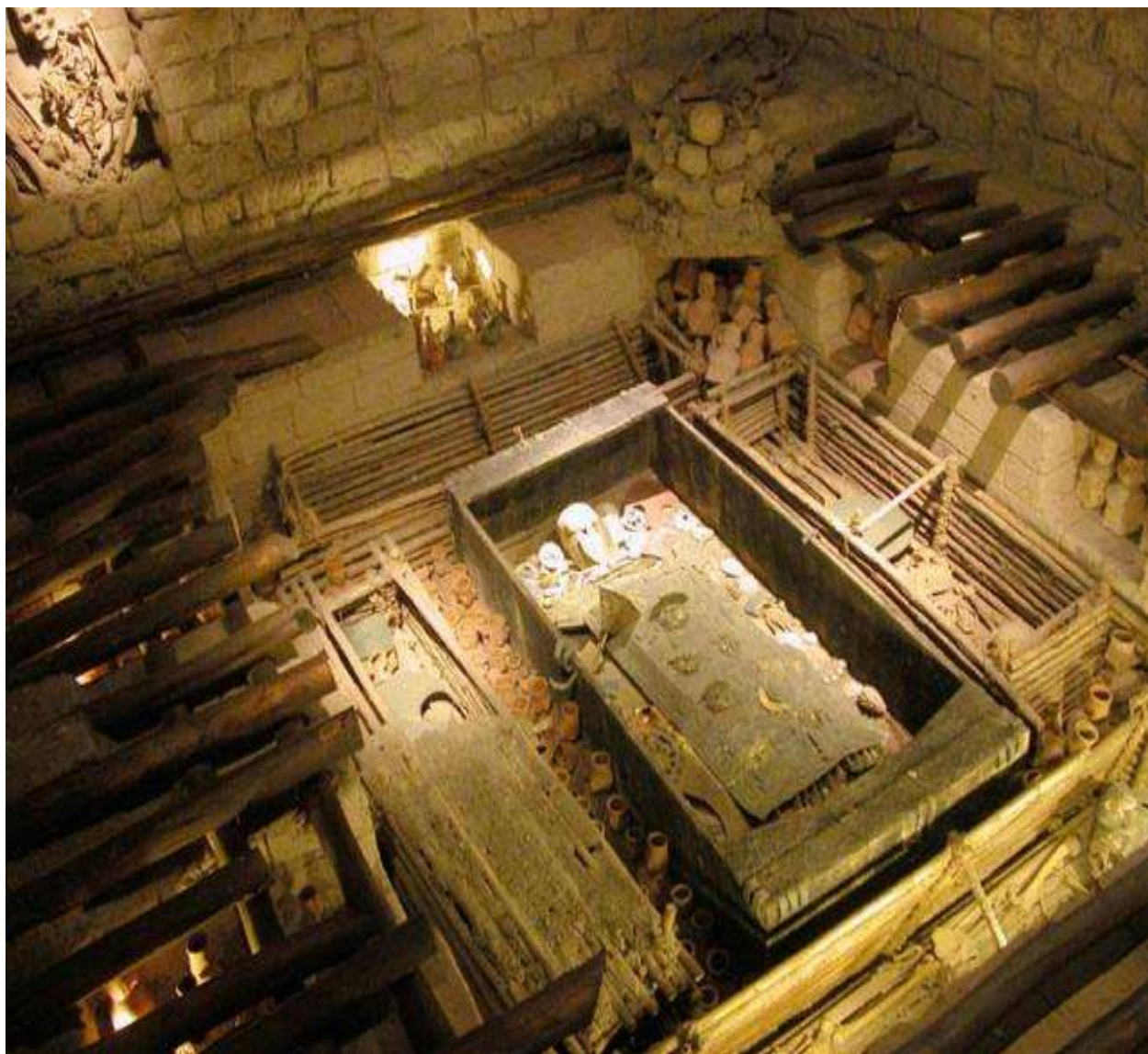
Museo de Sitio de Tumbas Reales, Sipán Lambayeque