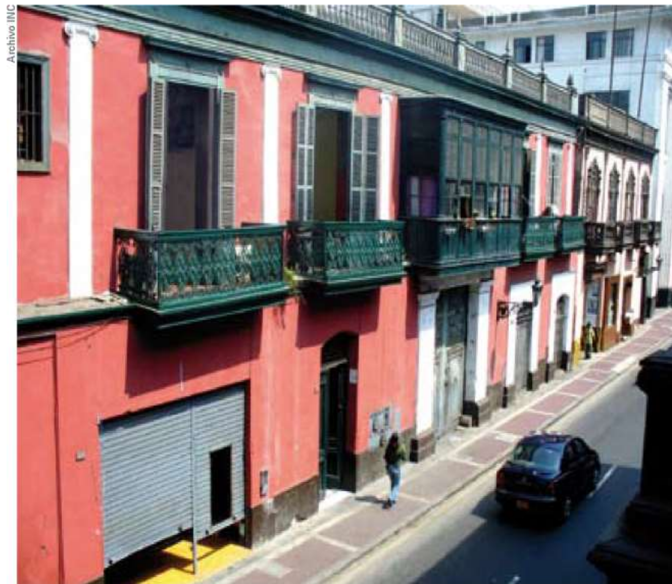
Casona, Esquina de los Jirones Huallaga y Azángaro, Lima.