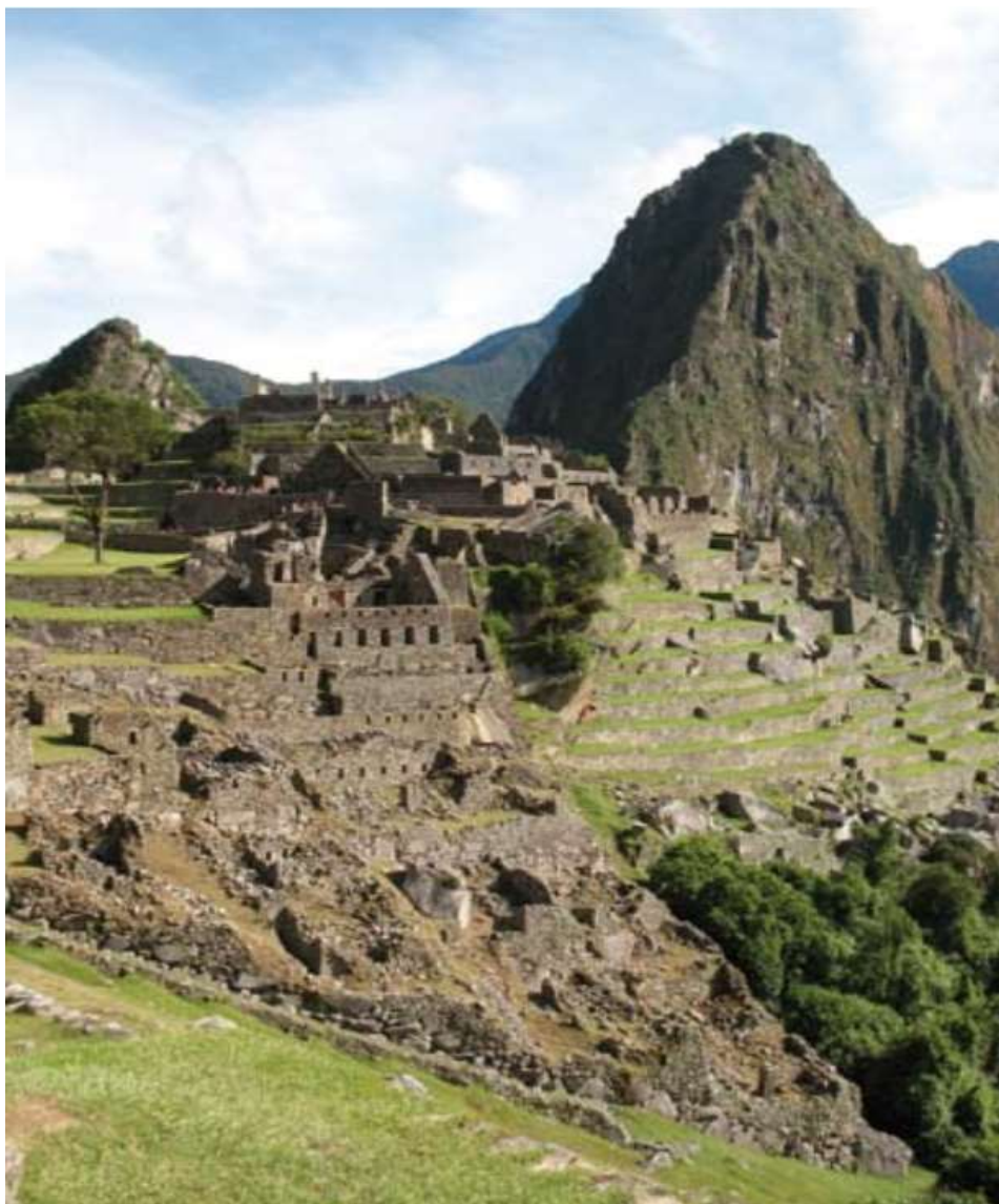
Macchu Picchu, Cusco Perú