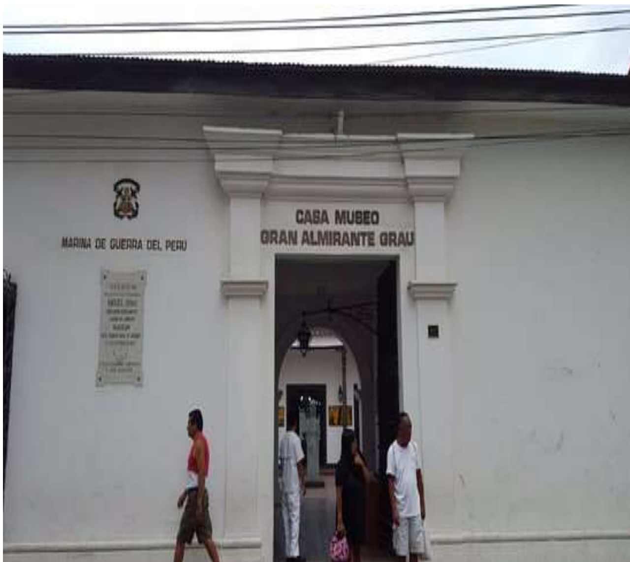
Casa Museo Gran Almirante Grau, Lambayeque – Perú