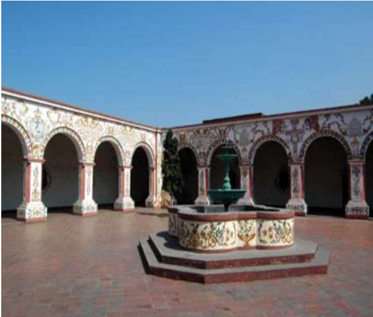
Convento de los Descalzos, Lima.