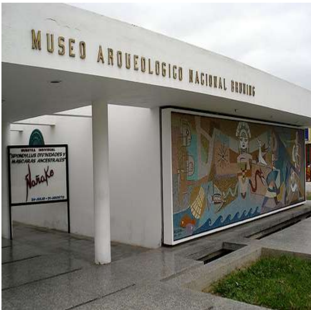
Museo Brunning, Lambayeque - Perú