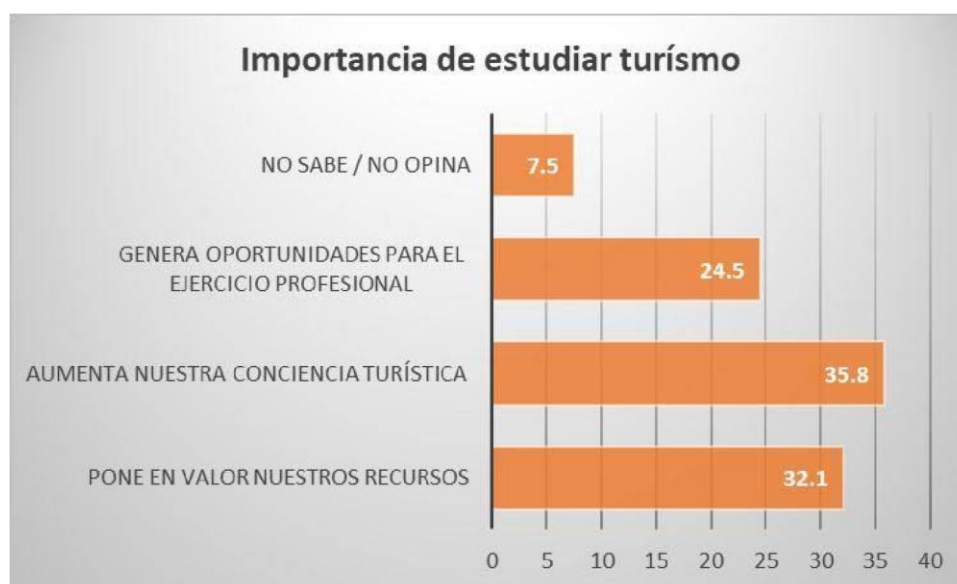
Tabla N° 07

. Gráfico n° 04: Importancia de hacer estudios de turismo