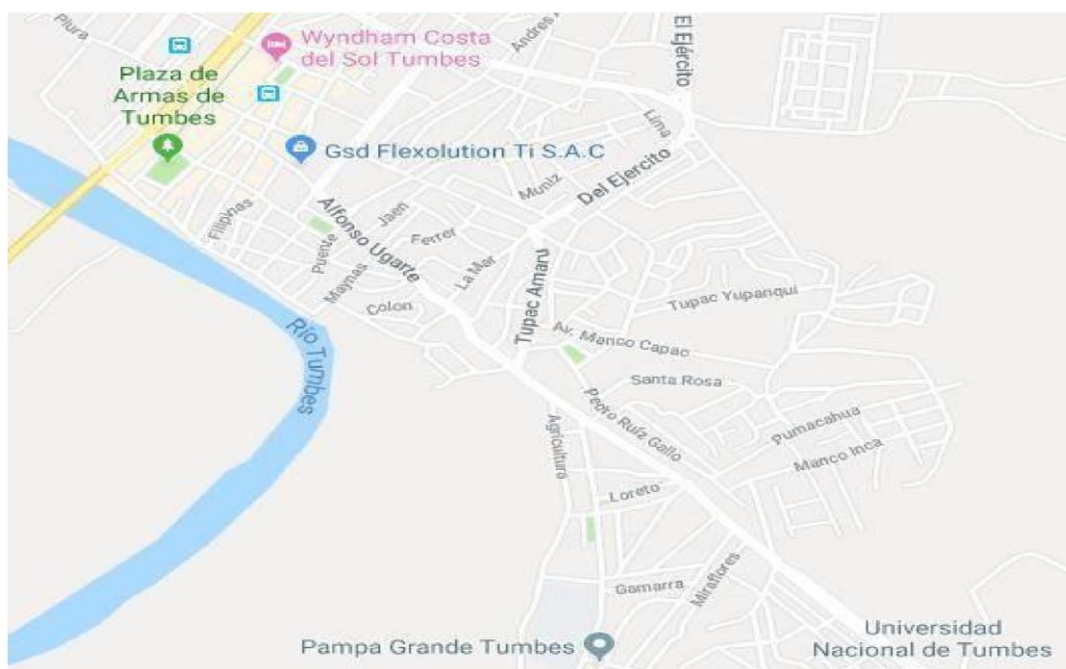
IMAGEN N° 01: UBICACIÓN DE LA UNIVERSIDAD NACIONAL DE TUMBES

Se ubica en el extremo noroeste del país, limitando al oeste y norte con el golfo de Guayaquil (océano Pacífico), al este con Ecuador, y al sur con Piura. Con 4 669.20 km 2 es el departamento menos extenso y con 42,9 hab/km 2 es el quinto más densamente poblado, por detrás de Lima, Lambayeque, La Libertad y Piura.