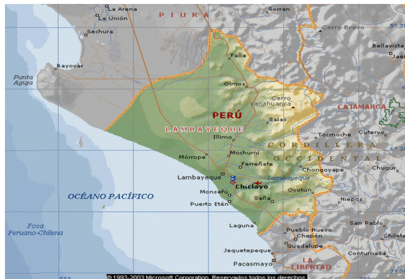
GRAFICO 01: UBICACIÓN DEL DISTRITO DE CHICLAYO

Su extensión territorial es de 252.39 km 2 . Sus límites son: al Norte, con los distritos de Picsi, J. L. Ortiz y Lambayeque; al Sur, con Zaña, Reque y La Victoria; al Este, con Zaña; al Oeste, con Pimentel y San José.