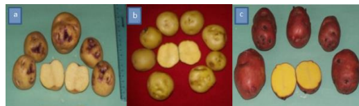
Figura 2. Imágenes de tubérculos del clon (a) BN4-C-1, clon (b) BN14-C-8 y Clon (c) BN3-A-4, en Llama-Cajamarca.