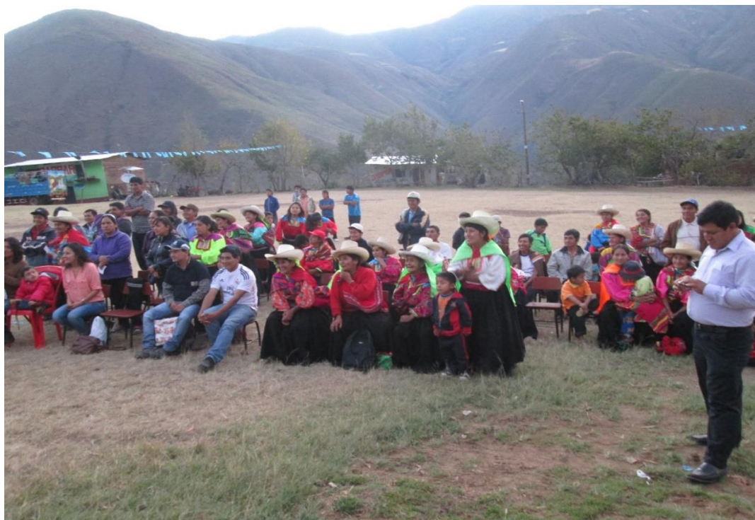
El cerro encantador de Mamahuaca – Chiñama- Cañaris.

las condiciones favorables para el buen vivir.